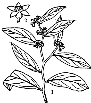
沉香 1. 花枝 2. 花

常绿乔木，高达三〇米。幼枝被绢状毛。叶互生，稍带革质，椭圆披针形，披针形或倒披针形，长五·五~九厘米，先端渐尖，全缘，下面叶脉有时被亚绢状毛。具短柄，长约三毫米。伞形花序。无梗，或有短的总花梗，被绢状毛。花白色，与小花梗等长或较短。花被钟形，五裂，裂片卵形，长〇·七~一厘米，喉部密被白色绒毛的鳞片一〇枚，外被绢状毛，内密被长柔毛，花冠管与花被裂片略等长。雄蕊一〇，着生于花被管上，其中有五枚较长。子房上位，长卵形，密被柔毛，二室，花柱极短，柱头大，扁球形。蒴果倒卵形，木质，扁压状，长四·六~五·二厘米，密被灰白色绒毛，基部有略为木质的宿存花被。种子通常一枚，卵圆形，基部具有角状附属物，长约种子二倍。花期三~四月。果期五~六月。